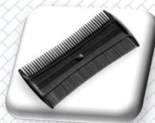
gęsty grzebień wyczesujący wszy i gniady